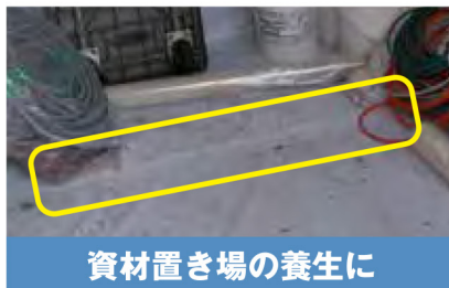
資材置き場の養生に