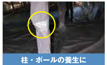
柱・ポールの養生に