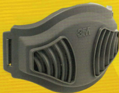
#1700 + #1744