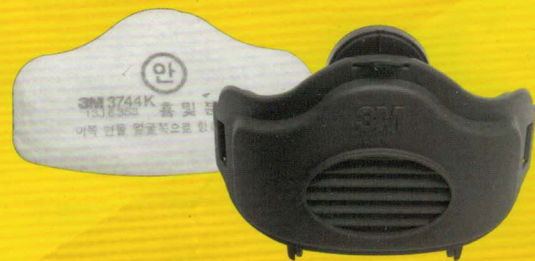
#3700 + #3744K